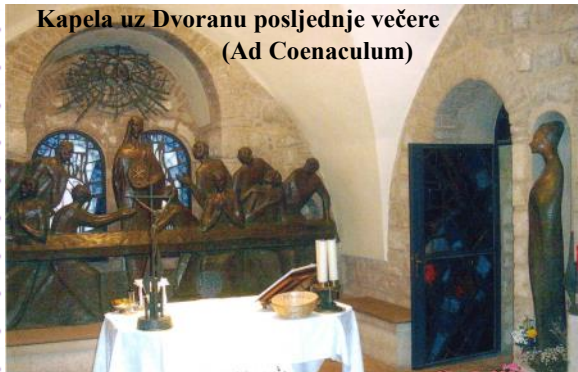
Kapela uz Dvoranu posljednje večere (Ad Coenaculum)